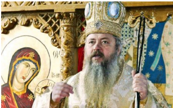
ÎPS Andrei Andreicuț - noul Mitropolit al Clujului